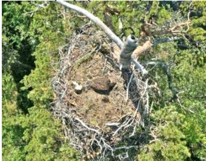
Рис. 3. Аэрофотоснимок гнезда орлана-белохвоста ( Haliaeetus albicilla ), полученный с БПЛА (Тертицкий и др., 2015)

Использование очков виртуальной реальности для получения изображения с бортовой камеры в высоком разрешении и управления квадрокоптером «от первого лица» позволит биологу-исследователю в буквальном смысле «заглянуть в гости» к изучаемому виду, не нарушая его естественную среду обитания (рис. 3).