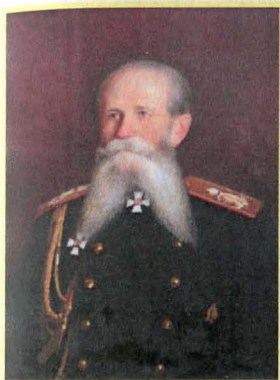
И.В. Гурко (1828-1901)