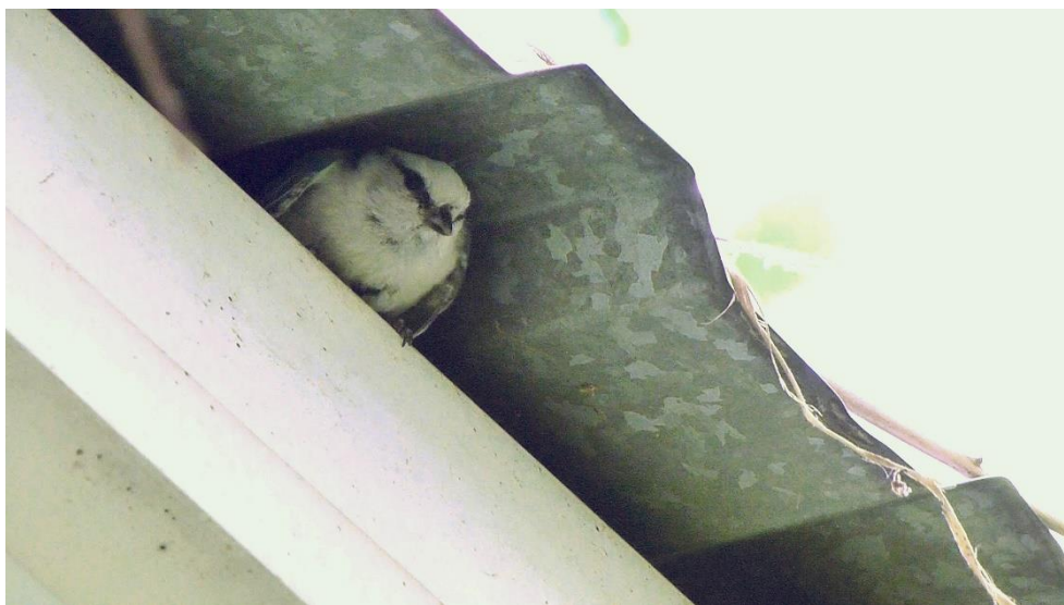
Р и с . 2 . Белая лазоревка у гнезда. 17 июня 2017 г. (по Виноградов и др., 2017).

Скучные факты о вероятном гнездовании князька на территории нынешней Тверской области касались до настоящего времени лишь встреч выводков. К.Н. Давыдов (1896) 15 июня 1895 г. «впервые встретился с выводком князьков около д. Воскресенского на берегу реки Городни». 14 августа 1896 г. ему «еще раз удалось наблюдать выводок Cyanistes cyanus близ села Благовещенья в густом березняке, причем старого самца посчастливилось добыть». Выводок из 8 птиц был встречен 26 июня 1988 г. в низовьях рр. Шоши и Ламы и их притоков в границах Государственного госкомплеса «Завидово» (Николаев, 1998).