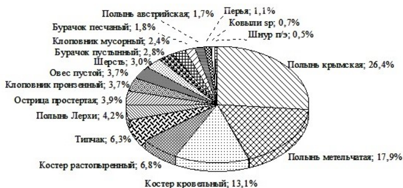
Рис. 3. Соотношение типов строительного материала гнезд черногорудого воробья (n = 11) в % от общей массы гнезда.

Средняя масса гнезда (n = 11) составляет 97,5 \pm 1,7 г. Морфометрические показатели гнезд представлены в таблице 3.